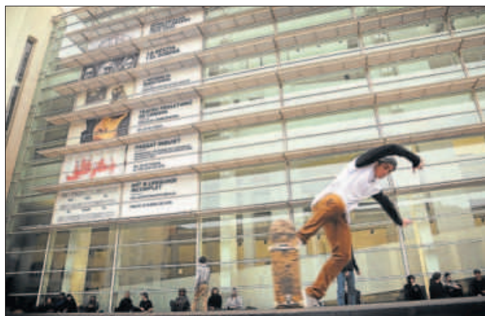
Façana del Macba, amb els cartells de les exposicions actuals

El que no volem és un Macba covard i que sigui un model de censura, que no assumeixi el compromís amb els artistes i els comissaris i s'espanti amb tanta facilitat. Un museu ha d'estar sempre en tensió amb la seva contemporaneïtat i amb la ciutat, i per descomptat en permanent risc per poder acollir la qualitat de les propostes més extremes i radicals. Ha de ser porós, permeable i penetrable per les friccions que provoca la producció cultural amb el lloc que l'acull. Ha de ser emancipat i independent. No ens serveix un museu d'art que simplement decori la ciutat.●