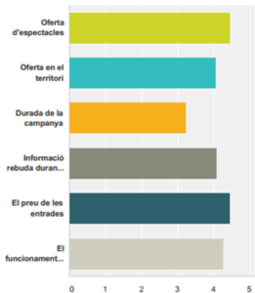
Respostes dels que han comprat entrades